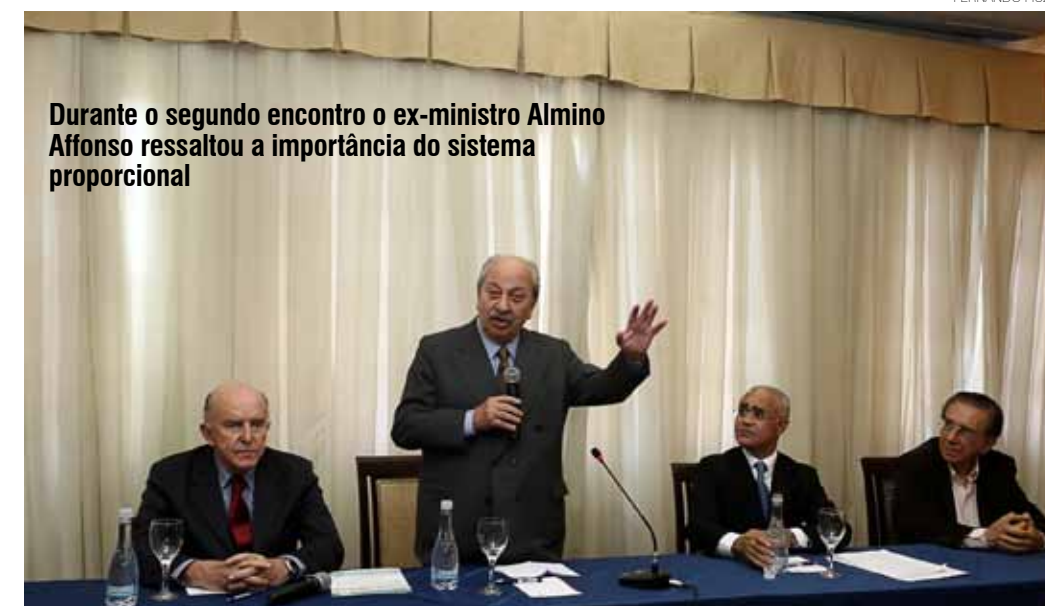
Durante o segundo encontro o ex-ministro Almino Affonso ressaltou a importância do sistema proporcional

“A grande virtude do sistema proporcional é o estímulo à inovação, às novas ideias. Permitindo maior diversidade de representantes, mais agen-