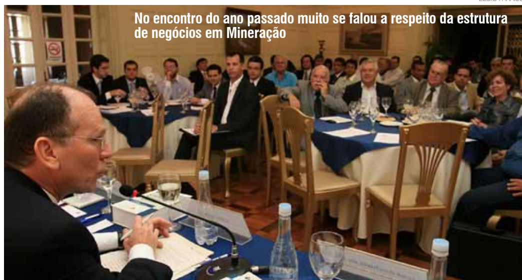
No encontro do ano passado muito se falou a respeito da estrutura de negócios em Mineração

No dia 1º de setembro, o IAMG promoverá o seminário sobre Direito Mineral que abordará neste ano o tema "Política Mineral e Soberania Nacional". Para o debate, foram convidados especialistas no assunto, representantes da alta direção do Departamento Nacional de Produção Mineral, com a presença de um representante da Comissão de Minas e Energia da Câmara dos Deputados.